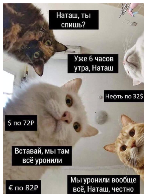
Рис. 4. Трансформация 3: рефрейминг