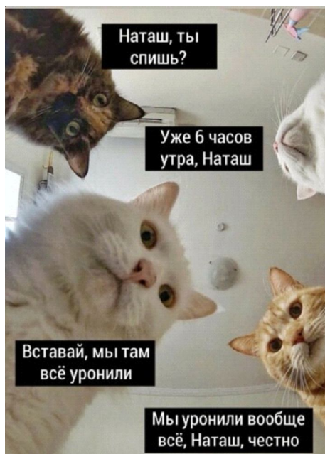
Рис. 3. Трансформация 2: «свертка» Fig. 3. Transformation 2: “convolution”

В первые месяцы 2020 г. мем не просто сохраняет свою актуальность, но активно вовлекается в рефрейминг – изменение ситуативной рамки. Впервые в контексте новостей мем появился в конце февраля, когда произошел масштабный обвал мировых рынков из-за COVID-19. Последующим инфоповодом для рефрейминга становятся текущие события, например обвал рубля, произошедший 9 марта после обвала цен на нефть (см. рис. 4).