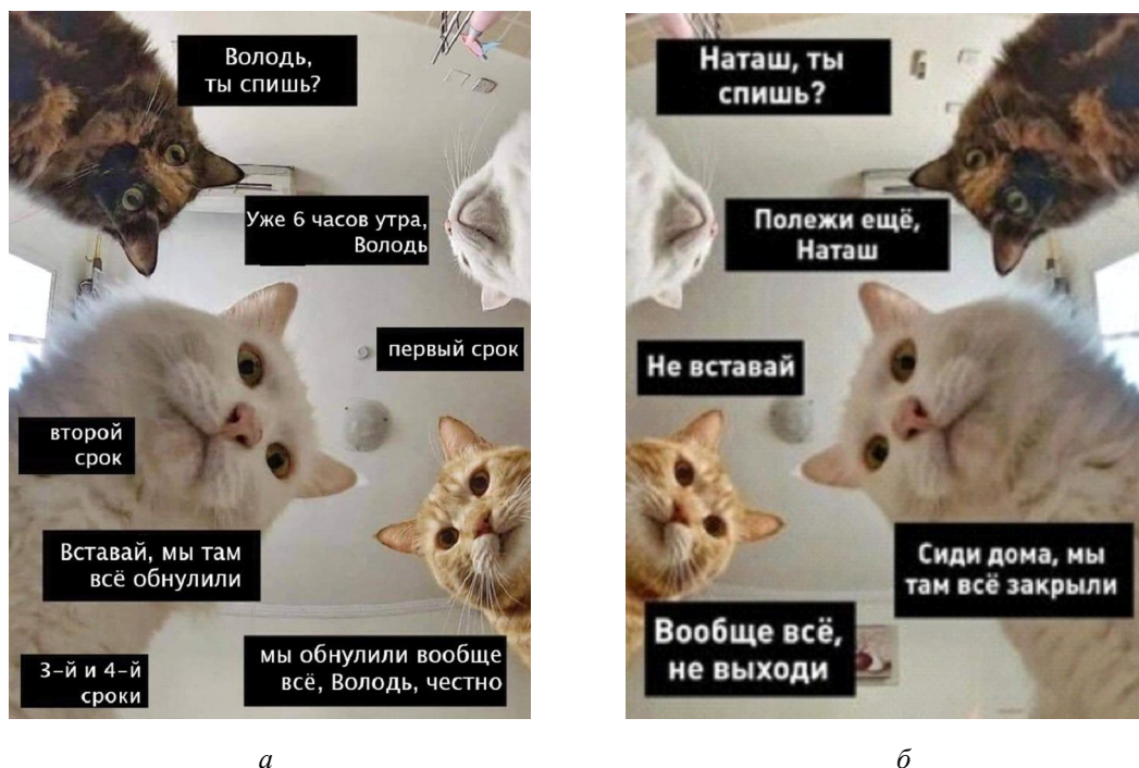
Рис. 5. Прагматическая трансформация Fig. 5. Pragmatic transformation

В апреле 2020 г. мем используется в контексте новых информационных поводов, в частности это речь президента В.В. Путина по поводу пандемии, где грядущая победа над «заразой коронавиральной» сравнивается с исторической победой над печенегам и половцами: «Наша страна не раз проходила через серьезные испытания: и печенеги ее терзали, и половцы, – со всем справилась Россия. Победим и эту заразу коронавиральную» (Владимир Путин...). Примечательно, что само президентское высказывание о врагах родины немедленно стало мемом и разошлось по сетям (см. рис. 1; по данным «Медиалогии», оно занимает 4-е место). В данном случае мы видим новую трансформацию – интертекстуальную , основанную на взаимодействии мемов, актуальных для конкретного периода (см. рис. 6, а).