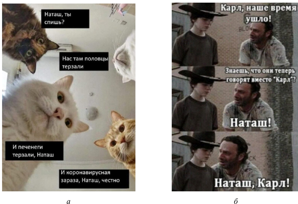
Рис. 6. Интертекстуальная трансформация – взаимодействие мемов и эффекты метакommunikации Fig. 6. Intertextual transformation – meme interaction and metacommunication effects