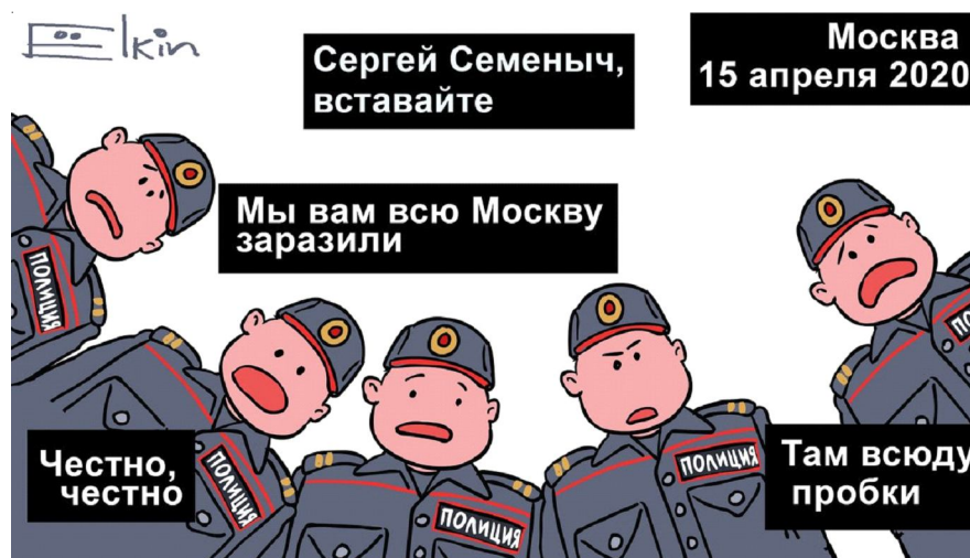
Рис. 8. Рефрейминг вербального и визуального шаблонов