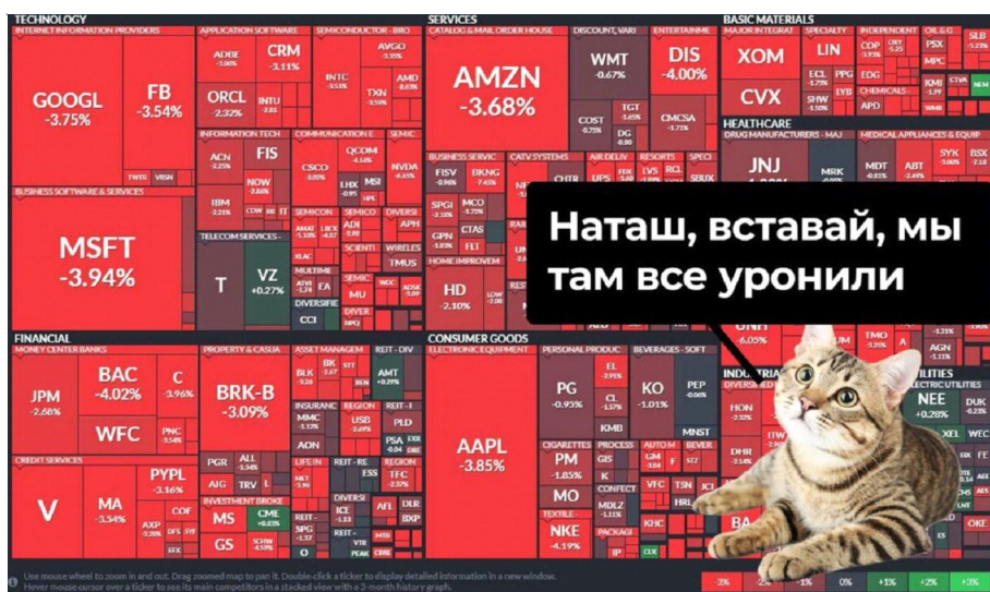
Рис. 7. Обвал фондовых рынков в «рамке» интернет-мема: редукция визуальных символов Fig. 7. Stock market crash in the “frame” of an Internet meme: reduction of visual symbols

пропусков, которое привело к скоплению людей на станциях метро. Прагматический потенциал данного поликодового текста коррелирует с предшествующими мемами-картинками (см. рис. 3, 4), где призыв вставай / вставайте является сигналом тревоги. Обращение к мэру Москвы С.С. Собянину имплицитно указывает на ответственного за ситуацию, что позволяет рассматривать дан-