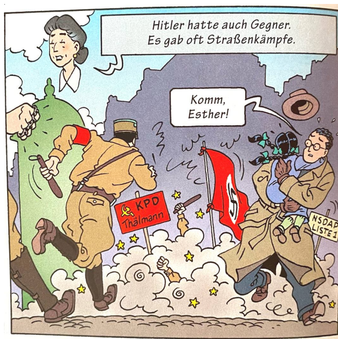
Рис. 1. Пример использования дейктической связи (Die Suche, S. 10)

Примером дейктической связи может послужить кадр (рис. 1), где в качестве знаков двух враждующих сторон выступают таблички: «KPD Thälmann» (Коммунистическая