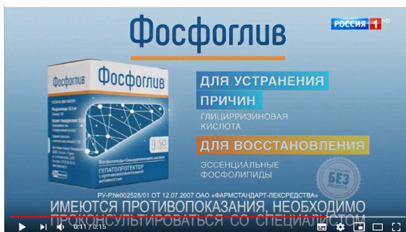
Рис. 3. Фрагмент рекламы лекарственного средства «Фосфоглив»

Для того чтобы вызвать доверие со стороны потребителя, отправитель нивелирует разностатусный характер дискурса и строит высказывание от первого лица (создает я-нарратив):