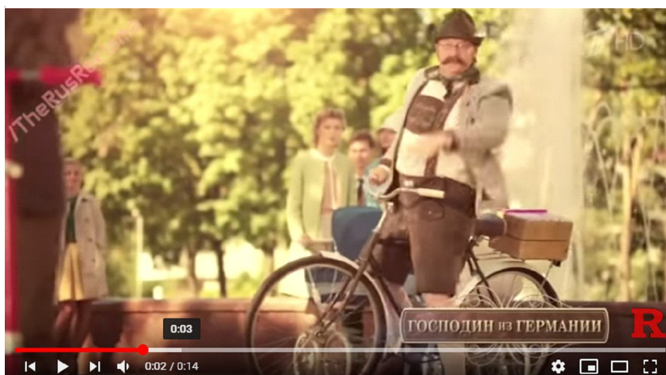
Рис. 1. Фрагмент рекламы лекарственного средства «Амбробене»

(2) Арбидол блокирует размножение вирусов и способствует их ликвидации , защищая семью ( https://www.youtube.com/watch?v=nFyAzM0zYZI ).