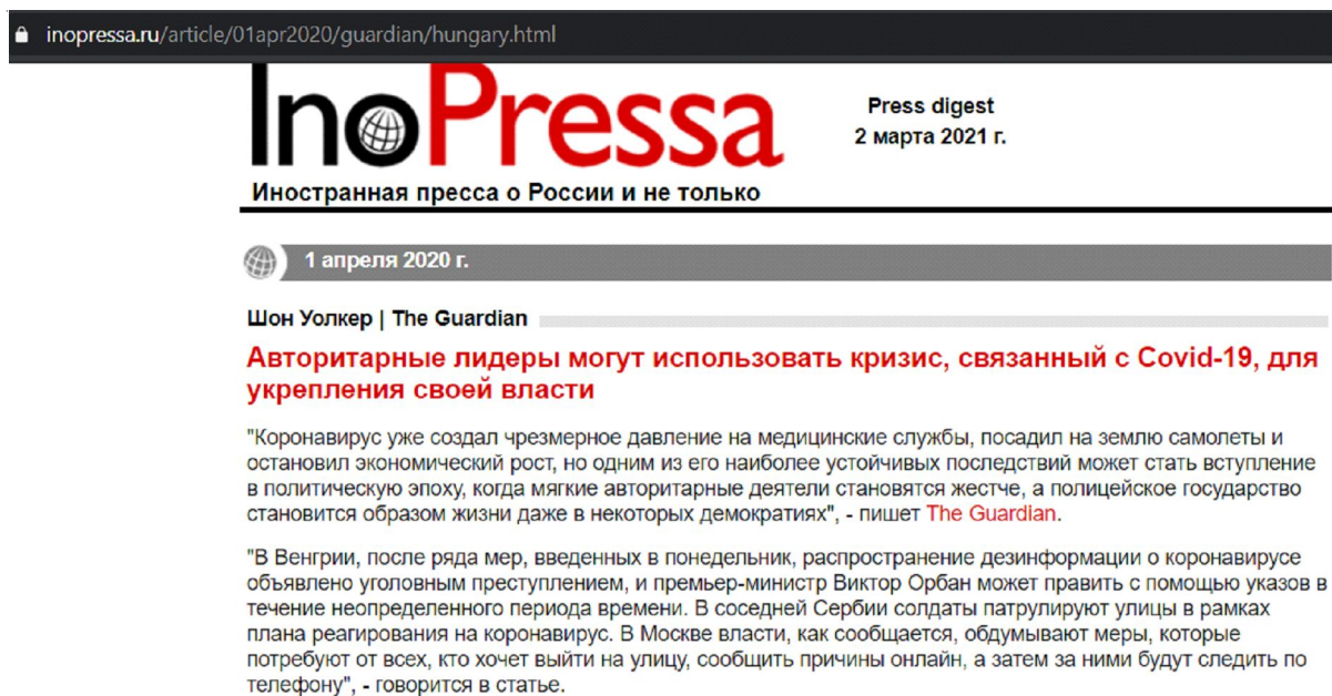
Рис. 2. Реализация интертекстуального элемента в переводе текста аналитической статьи по юриспруденции Fig. 2. Intertextual element in the translated text of an analytical article on legal issues

В тексте оригинала аллюзия в силу резонансного характера темы распознаваема для потенциального реципиента, чем обусловлено отсутствие ссылки на текст, освещающий прецедент. Однако для русскоязычной аудитории интерпретация аллюзии сопряжена