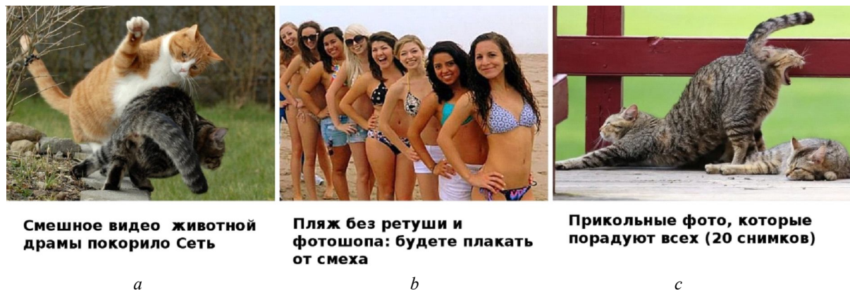
Fig. 1. A promise of laugh moments: