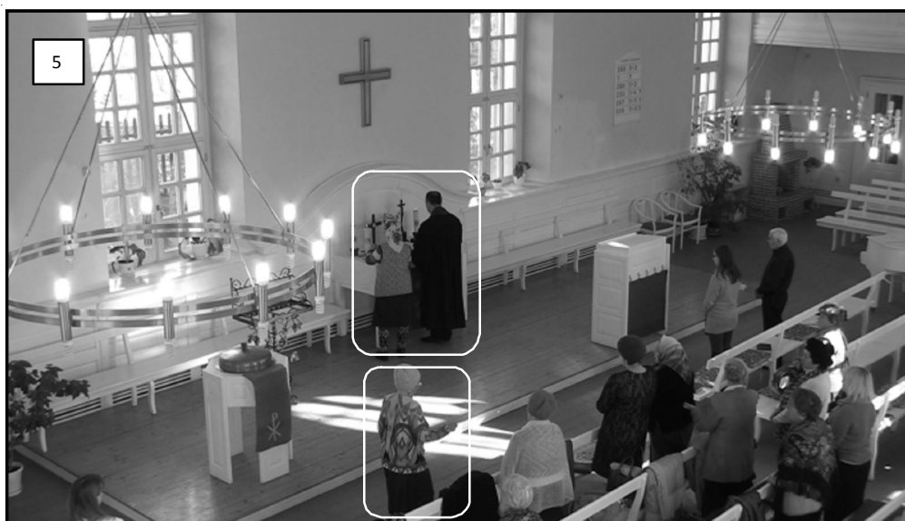
Рис. 5. Структурная открытость ритуала

Поведение обеих женщин представляет интересным с той точки зрения, что обе прихожанки уже без официального повода оказываются легитимными и потенциальными участниками ритуала, позиционируют себя как члены общины, при этом их поведение в пространстве церкви, фиксируемое общиной и религиозными служителями (на службе присутствует пастор из Германии), не воспринимается как «ненорма» и, соответственно, не дестабилизирует и не прерывает ход богослужения. Такое возможно в том случае, если модель совершения ритуала структурно открыта.