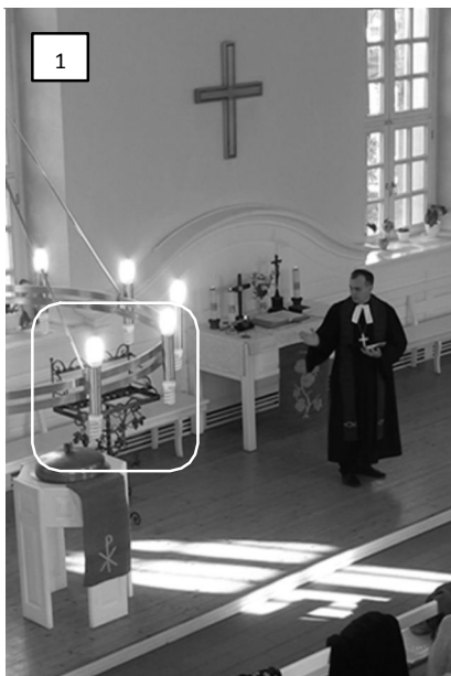
Рис. 1. Указание на подсвечник

Интересными в этой связи представляются два жестикуляторных указания пастора: прежде всего он показывает правой рукой на находящийся в полутора метрах от него в пространстве алтаря подсвечник, предназначенный для установки зажженных свечей (рис. 1). Затем он поворачивается к алтарю и указывает правой рукой на алтарную свечу, от которой необходимо зажигать свечи (рис. 2). Таким образом, основные позиции ритуала выражены мультимодально: вербально и жестикуляторно. При этом пастор ни вербально, ни жестикуляторно не указывает на свечи, предназначенные для возжигания и расположенные в форме креста на первой от алтаря скамье, от которых, собственно, и начинается путь прихожан к алтарной свече.