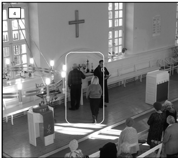
Рис. 4. Структурная разновременность в ритуале (фрагмент 2)

Зафиксированы также случаи, когда семья не упоминается общиной (родственник отсутствует), однако это никак не отражается на протекании ритуала, поскольку важно в данной модели то, что община поминает всех умерших, в том числе и каждого поименно названного. Это свидетельствует, скорее, о категориальной, чем об индивидуальной ориентации ритуала, что и выражается иногда в несовпадении зачитывания имени умершего или умерших, телесно-пространственной репрезентации и видимой репрезентации тех умерших, представители которых отсутствуют на богослужении. Предпосылкой этого в первую очередь является децентрализованная, трехпозиционная пространственная структура значимых объектов: свечи на первой от алтаря скамье, алтарная свеча, подсвечник для зажженных свечей.