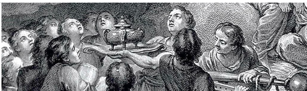
Рис. 5. Фрагмент фронтисписа. Люди приносят подношения Храму Истины

Фронтиспис к первому тому Энциклопедии Д. Дидро и Ж. Даламбера принадлежит к смешанным знакам, сочетая изображение события и вербальный компонент в виде подписи, четко обозначающей данный жанр ( Frontispice ). Как паратекстовое средство он создает «оптический образ» Энциклопедии и