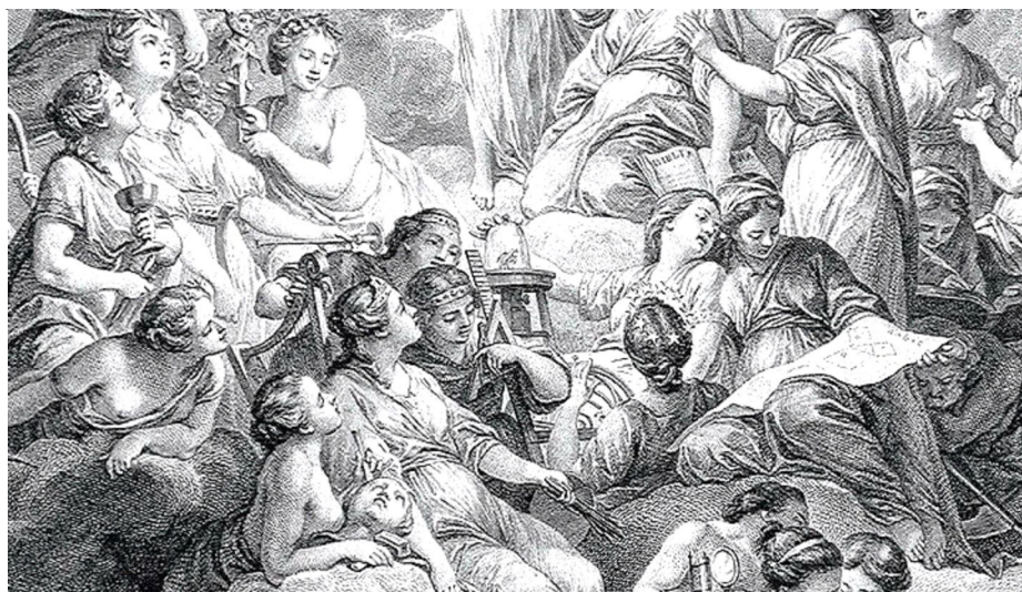
Рис. 3. Фрагмент фронтисписа. Фигуры, символизирующие Музыку, Скульптуру, Живопись, Архитектуру

Подобный способ визуализации уже имеющихся и новых знаний оказался под своеобразным влиянием театральности культуры Нового времени. Одним из объединяющих факторов мировоззрения Нового времени выступала концептуальная метафора «мир – театр», проявлявшая себя в различных формах, в том числе таких как «знание – это театр», «книга – это театр». Думаем, что гравюра Б.-Л. Прево, давшая рождение фронтиспису Энциклопедии Д. Дидро и Ж. Даламбера, представляет концептуальное единство, являясь составляющей особого текстового альянса, так называемого «книжного театра» [Бычков, 2014]. Аккумуляция информации в условиях плюрализации знания стала ключевой особенностью «книжных театров» XVII–XVIII веков. В случае с фронтисписом Энциклопедии результат проявился в высокой информативности такого текстового альянса.