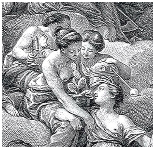
Рис. 4. Фрагмент фронтисписа. Фигуры, символизирующие Оптику, Ботанику, Химию и Агрономию

При создании рисунка был использован один из приемов живописи, также испытавший влияние архитектуры – триангуляция, то есть придание любому сложному по конфигурации пространству треугольной формы (САРТ). С одной стороны, подчеркивается роль Истины как вершины визуального треугольника в освещении Науки и Изобразительных Искусств. С другой стороны, мы наблюдаем динамичное движение от основания к вершине, которое призвано акцентировать внимание на служении Изобразительных Искусств и Наук раскрытию Истины. В таком художественном треугольнике обеспечивается связность сюжета: все персонажи взаимозависимы друг от друга. Эта взаимосвязь усиливается одинаковым стилем одежды (античные тоги), которая демонстрирует единение под крышей храма Искусств и Наук. Персонажи гравюры символизируют знания, которые необходимо передать толпящимся внизу людям (рис. 5), которые держат подношения Храму Истины и являются основанием треугольника, откры-