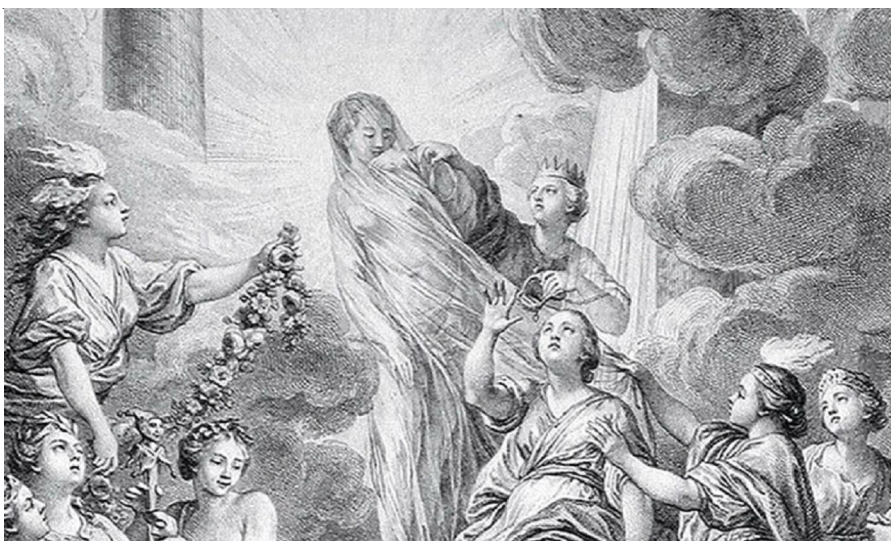
Рис. 2. Фрагмент фронтисписа. Фигуры, символизирующие Истину, Разум, Философию, Теологию

Слева, в момент «открытия» Истины, крылатое Воображение (l'Imagination) готовится украсить ее венком. Фигуры Воображения и Разума расположены ближе всех к Истине, поскольку, согласно мировоззрению Д. Дидро, для поддержания знаний важны именно эти человеческие способности. Людское воображение порождает искусства, а человеческий разум дает жизнь наукам. Как доказательство данного тезиса все виды Искусства и Науки (les Arts et les Sciences) разме-